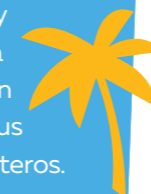
Playa del Gunga

Desde los manglares de la laguna de Mundaú hasta la desembocadura del río São Francisco, en Pontal do Peba, la región Sur alberga destinos muy frecuentados por turistas y lugareños, como la famosa Praia do Francês y la región de Jacarecica do sul, con sus acantilados y vastos cocoteros.