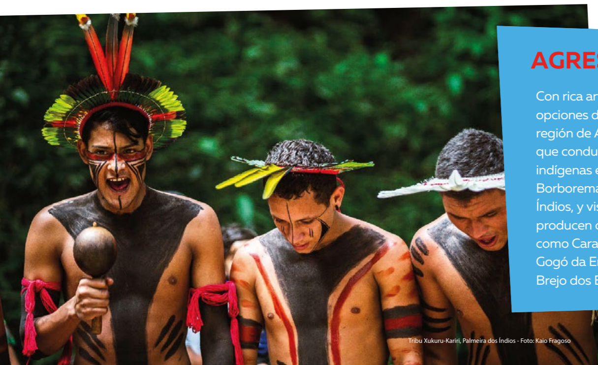
Tribu Xukuru-Kariri, Palmeira dos Índios