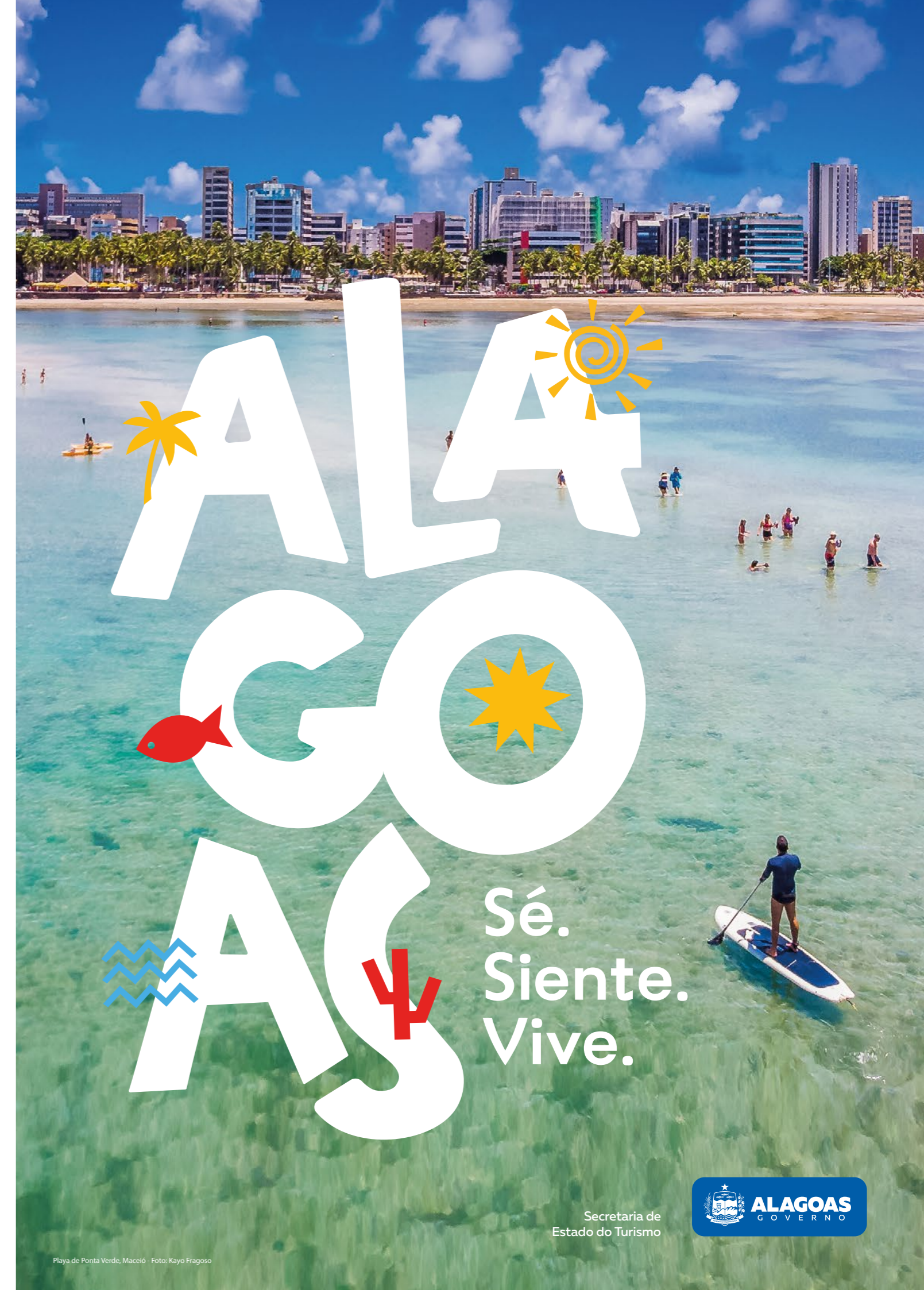
Playa de Ponta Verde, Maceió