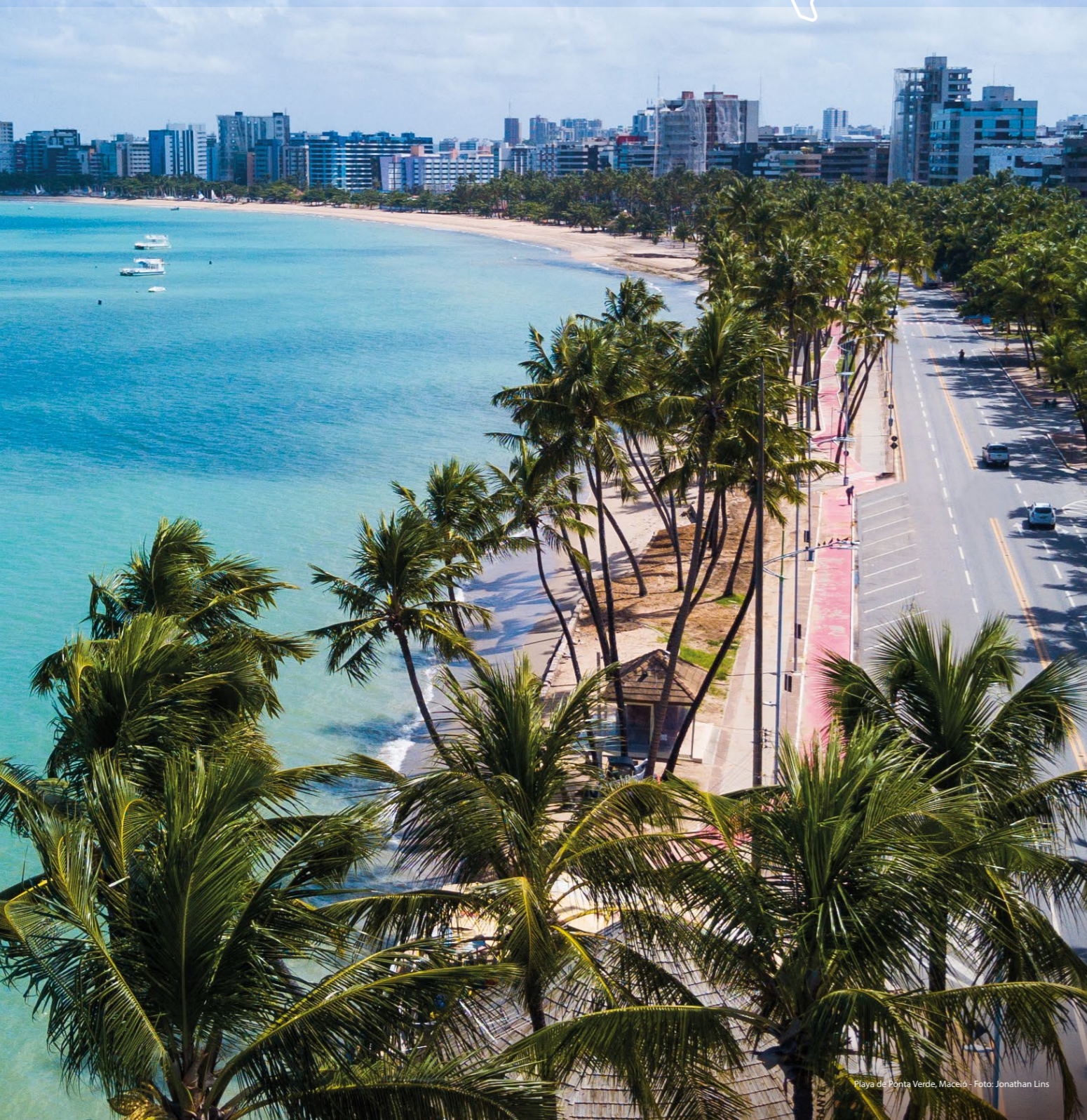
Playa de Ponta Verde, Maceió