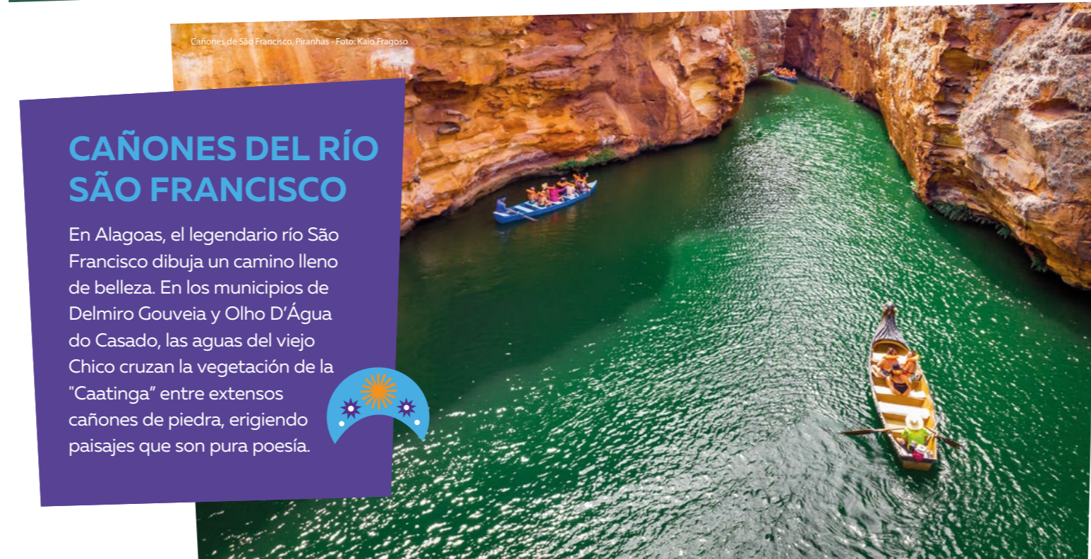
Cañones de São Francisco, Piranhas