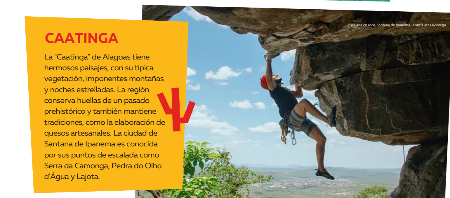
Escalada en roca, Santana do Ipanema