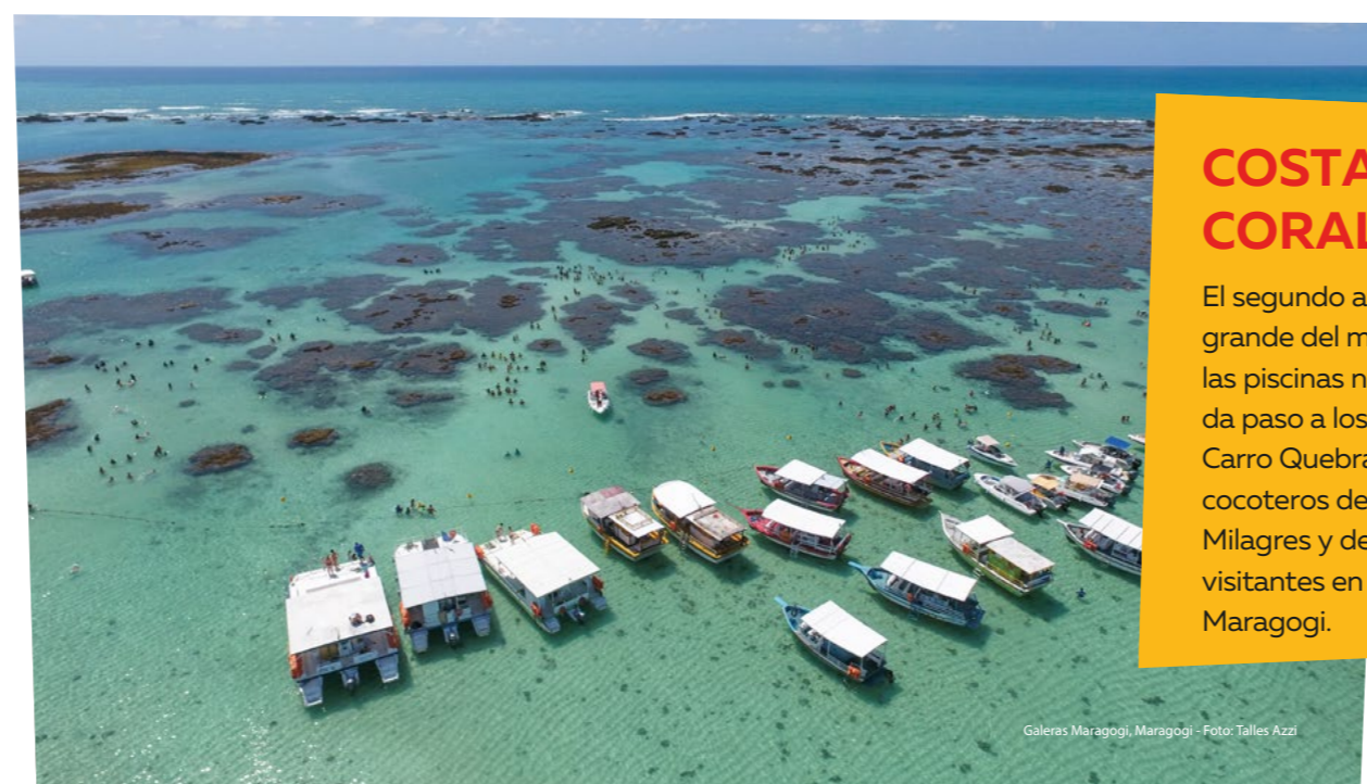
Galerías Maragogi, Maragogi